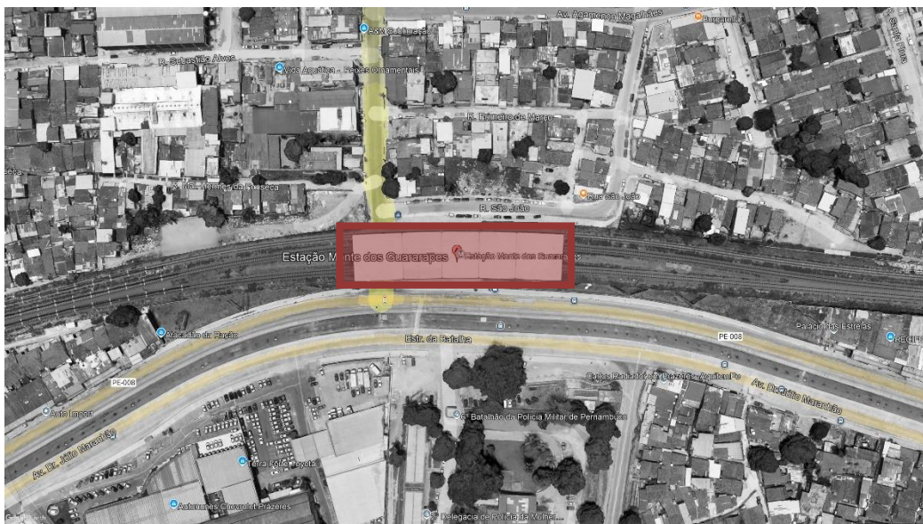
FIGURA 1 – ESTAÇÃO MONTE DOS GUARARAPES